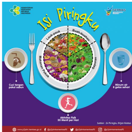
Gambar 5. Isi Piringku

Diet seimbang dan piring nasiku perlu diterapkan secara konsisten untuk lansia Indonesia. Makanan yang kita makan sangat berpengaruh pada kesehatan kita. Sebuah penelitian menunjukkan bahwa pada orang yang makan lebih banyak buah dan sayuran per hari tingkat kepuasan hidup meningkat pada akhir penelitian (Conner & Norman, 2017).