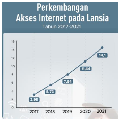
Gambar 1. Perkembangan Akses Internet pada Lansia (Susenas 2021)

Survei Sosial Ekonomi Nasional (Susenas) 2021 dari Badan Pusat Statistik (BPS) menyatakan sebanyak 14,1 % lansia di Indonesia mengakses internet pada tahun 2021. Angka ini jauh meningkat pesat dibandingkan tahun 2017 di mana hanya 2,98 % lansia yang berselancar di internet. Tren peningkatan akses internet pada lansia pun konsisten setiap tahunnya. Pada tahun 2018, jumlah lansia yang mengakses internet naik menjadi 5,73%. Kemudian pada tahun 2019 kembali naik menjadi 7,94%. Tahun 2020 saat pandemi Covid-19, akses internet di kalangan lansia menyentuh angka 11,44 (BPS, 2022).