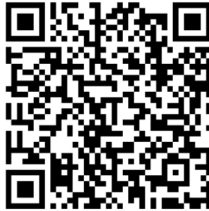
Gambar 4. QR Code aplikasi PANDU-Ina

Aplikasi PANDU-Ina dikembangkan berdasarkan survei analisis kebutuhan yang menunjukkan bahwa kemudahan penggunaan aplikasi dan manfaat merupakan hal yang penting dalam mengembangkan perangkat teknologi untuk caregiver dan ODD. Dari survei ini didapatkan beberapa jenis fitur yang sesuai dengan kebutuhan pengguna. Aplikasi PANDU-INA telah mendapat hak kekayaan intelektual (MWS Nasrun et al., 2023) dan saat ini sedang dilakukan penelitian uji efektivitas aplikasi terhadap kualitas hidup ODD dan caregiver -nya.