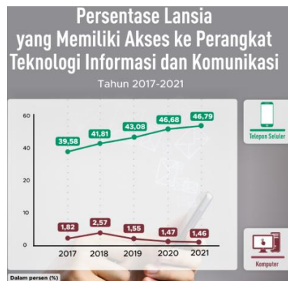
Gambar 2. Persentase Lansia yang Memiliki Akses ke Perangkat Teknologi Informasi dan Komunikasi (BPS, 2022)

Ditinjau dari jenis perangkat TIK, lansia cenderung lebih banyak menggunakan telepon seluler (ponsel) dibandingkan dengan komputer. Pertumbuhan pengguna ponsel di kalangan lansia meningkat secara stabil dalam kurun waktu 2017-2021. Pada tahun 2021, sebesar 46,79% persen lansia menggunakan ponsel. Penggunaan ponsel lebih praktis daripada komputer karena mudah dibawa kemana saja. Seiring dengan peningkatan tersebut, penggunaan komputer cenderung menunjukkan tren penurunan.