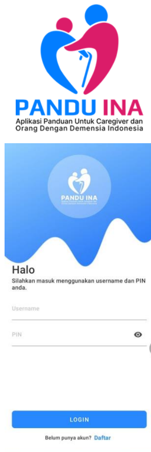
Gambar 3. Aplikasi PANDU-Ina

fisik (tidak bisa mandiri dalam membuat keputusan, menganalisis situasi, mengenali waktu dan tempat, berbelanja dsbnya) sedang berusaha mencoba mengatasi atau menyelesaikan problem yang dihadapinya dalam menjalankan aktivitas hariannya. Seorang dengan demensia yang marah-marah mengamuk, bisa jadi sedang berjuang keras mempertahankan harga diri dan privasinya ketika seorang caregiver mencoba membantu memandikan membersihkan dirinya, bisa saja ODD merasa privasinya dilanggar orang tak dikenal.